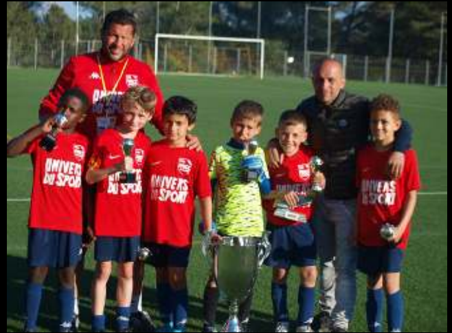
AS CAGNES LE CROS: Champion U9 2022

Le Samedi 29 Avril et le Dimanche 30 Avril 2023, l'US Venelles est fière de vous accueillir pour sa 8ème édition du Challenge National C.Chapartéguy. Durant ce week-end de compétition, 120 équipes venues des 4 coins de l'hexagone donneront tout pour remporter le prestigieux trophée.