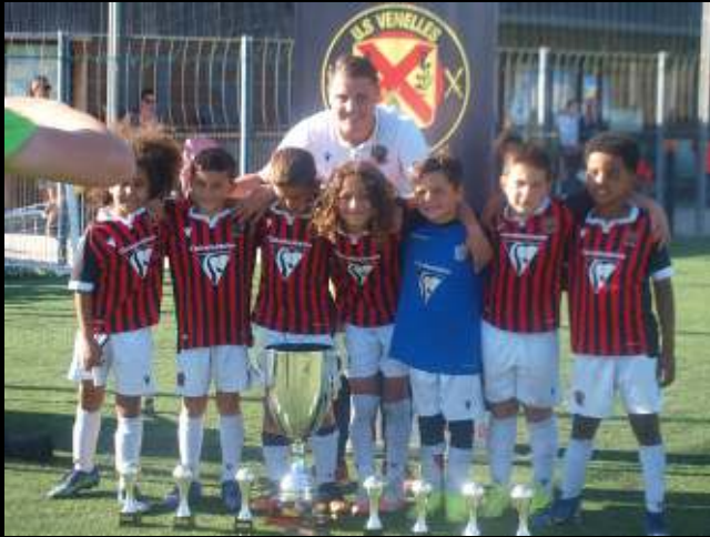
OGC NICE: Champion U8 2022